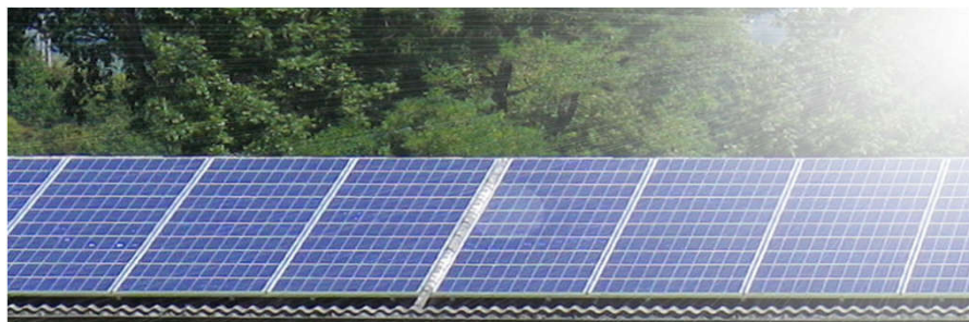
30kW Solarpanel der DKT auf Landwirtschaftsgebäude