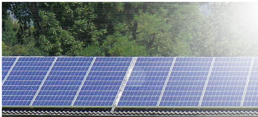
30kW Solarpanel der DKT auf Landwirtschaftsgebäude