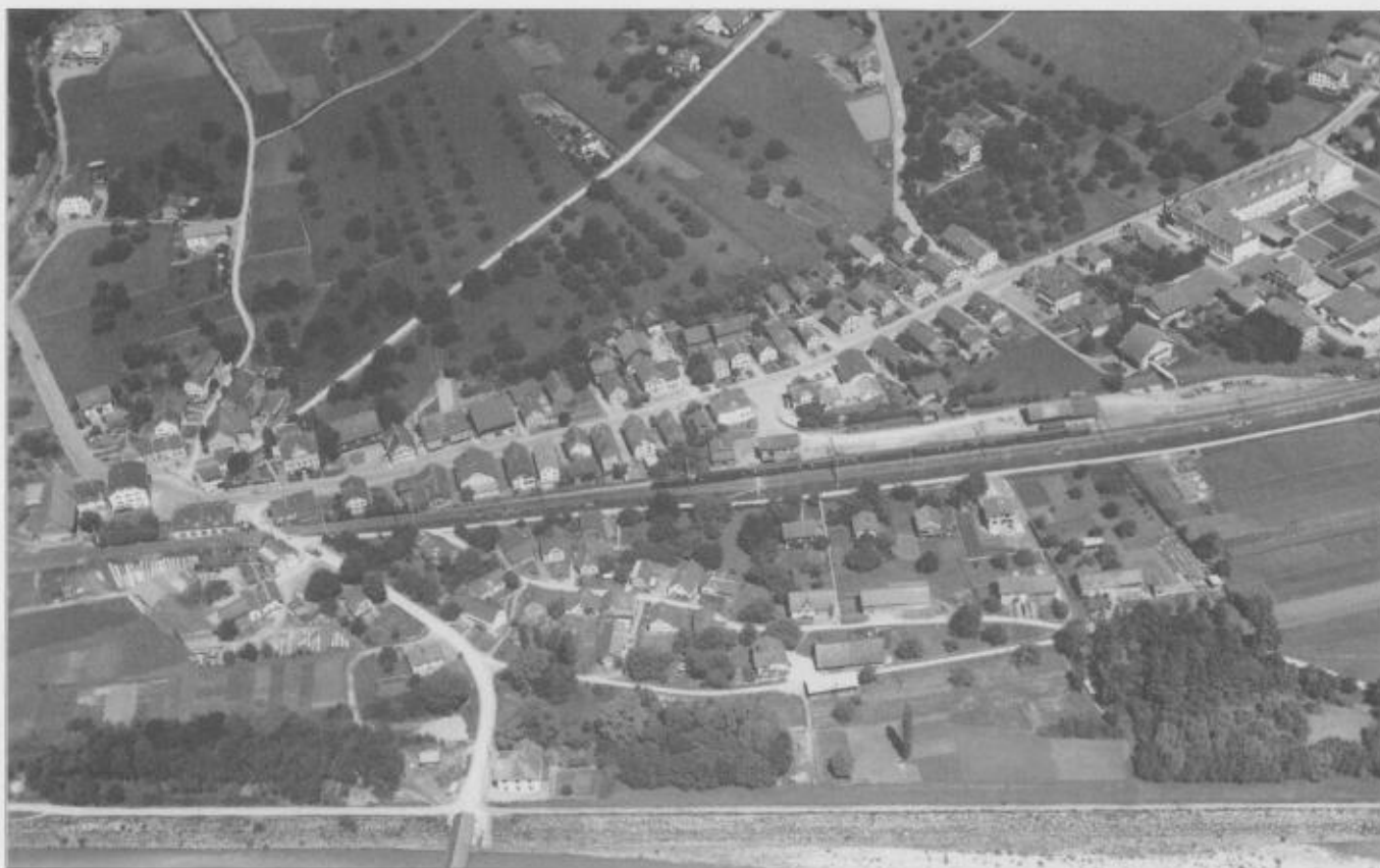
Karte um 1945 – Trübbach vor 70 Jahren